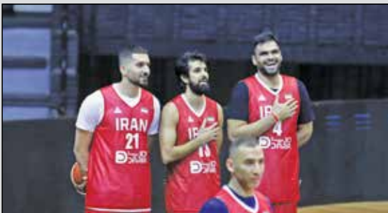
سه بازیکن از سه تیم مختلف و حالت خواندن سرود ایران وسط تمرین!