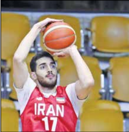
نوبدرضایی فریگی از جوان‌های بسکتبال ایران که هنوز نوشته به جایگاهی در حد و اندازه نوتانی‌هایش برسد.