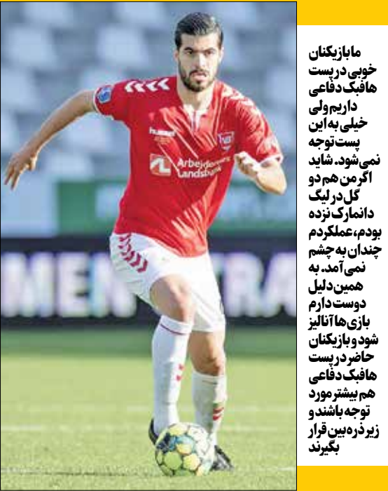
ما بازیکنان خوبی در پست هافبک دفاعی داریم ولی خیلی به این بست توجه نمی‌شود. شاید اگر من هم دو گل در لیگ دانمارک زده بودم، عملکردم چندان به چشم نمی‌آمد. به همین دلیل دوست دارم بازی‌ها آلتایز شود و بازیکنان حاضر در پست هافبک دفاعی هم بیشتر مورد توجه باشند و زیر ذربین قرار بگیرند

به عنوان نمونه مرسی ريو آوآ به شناختی که از مهدی طارمی در جام جهانی داشت و با مشاوره‌هایی که از کارلوس کی‌روش گرفته بود، او را انتخاب کرد، وگرنه مهدی طارمی به خاطر حضور در فوتبال قطر